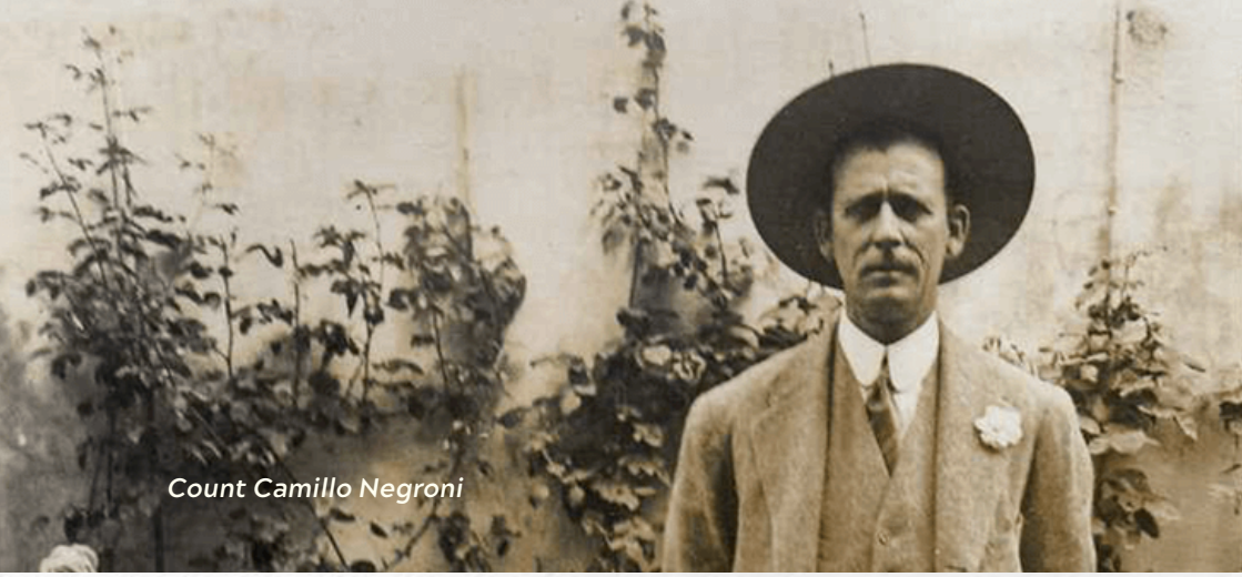
Count Camillo Negroni

Kokteyl, sonunda ona hayran olan Kont'un adını aldı.